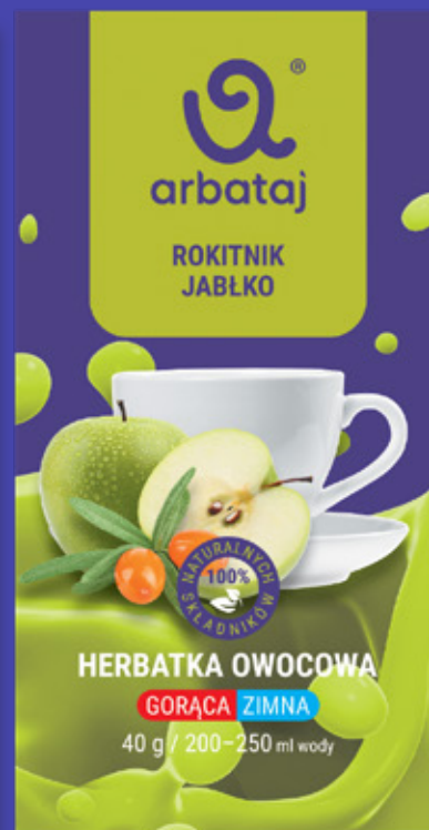
Frucht- und Beerenmischung SANDDORN & APFEL Getränk