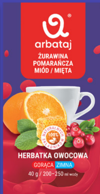
Frucht- und Beerenmischung MOOSBEERE & PFEFFERMINZ Getränk