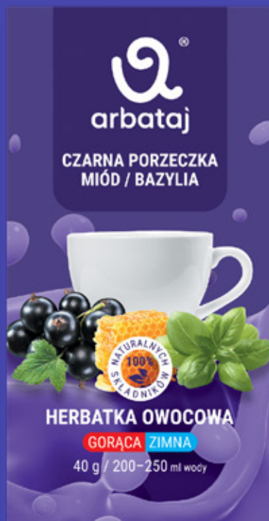
Frucht- und Beerenmischung SCHWARZE JOHANNISBEERE & BASILIKUM Getränk