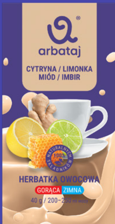
Frucht- und Beerenmischung LIMETTE & INGWER Getränk