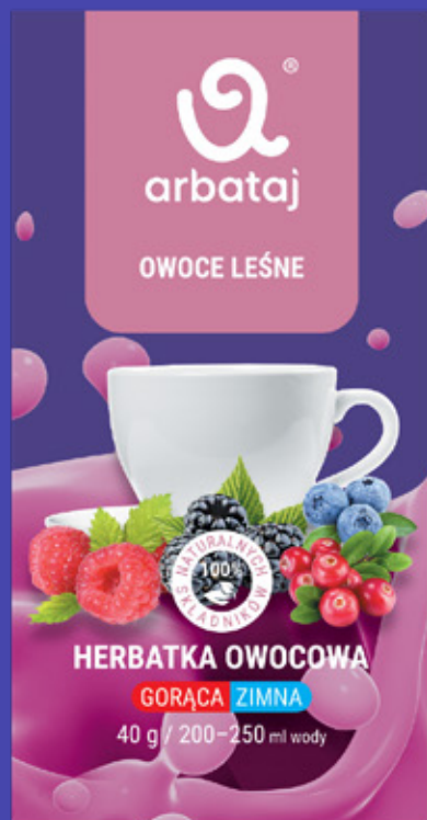
Frucht- und Beerenmischung WALDRÜCHTE Getränk