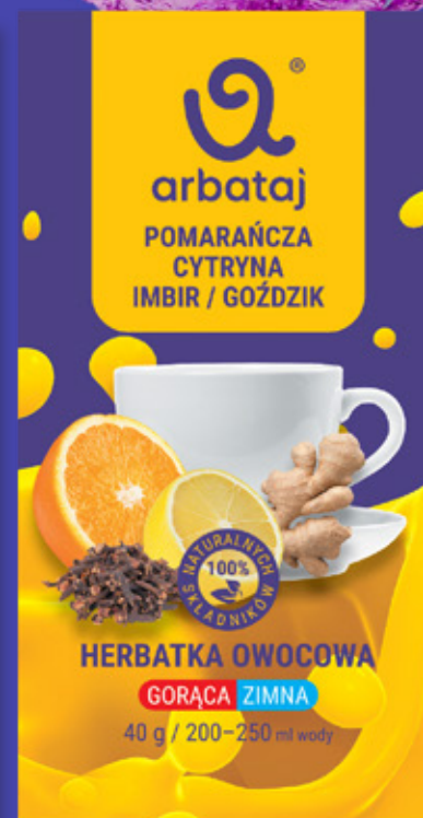
Frucht- und Beerenmischung ORANGE & NELKE Getränk