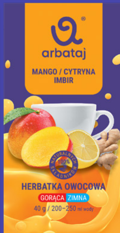
Frucht- und Beerenmischung MANGO & INGWER Getränk