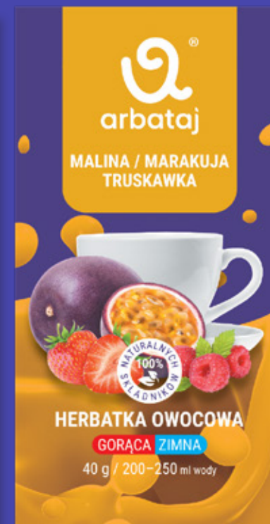
Frucht- und Beerenmischung MARACUJA & ERDBEERE Getränk