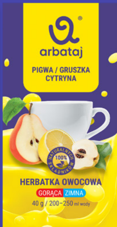
Frucht- und Beerenmischung BIRNE & ZITRONE Getränk