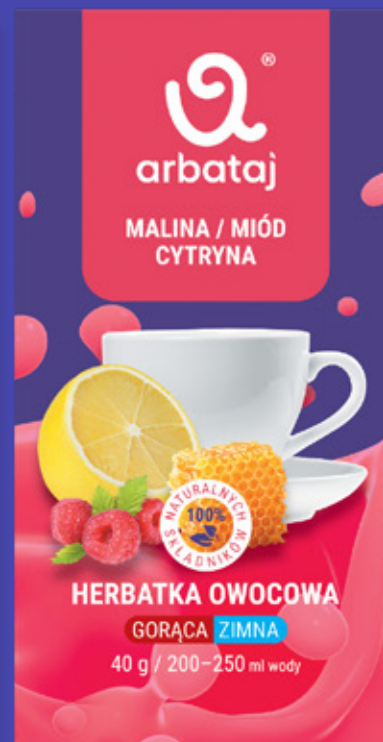
Frucht- und Beerenmischung HIMBEERE & HONIG Getränk